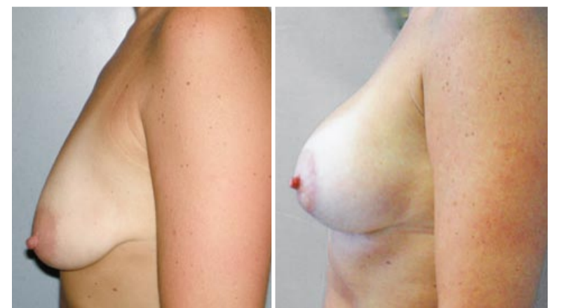
Pre e postoperatorio nella chirurgia della mastopessi additiva.

Negli ultimi anni si sta affermando una tecnica alternativa al re-intervento "radicale", e cioè l'uso di cellule staminali (cellule primitive non specializzate dotate della singolare capacità di trasformarsi in diversi altri tipi di cellule del corpo) adipose prelevate dalla paziente stessa. Trat-